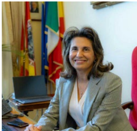
Giovanna Spatari Rettrice dell'Università di Messina