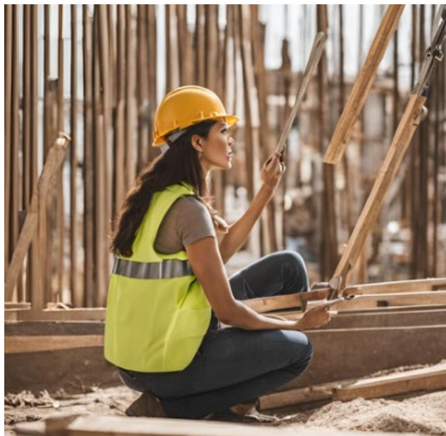
Immagine generata con Canva AI

Possiamo pensare alla salute e alla sicurezza sul lavoro in una prospettiva di genere? La risposta è sì ed è possibile attraverso informazioni e raccolte di dati con criteri che riguardano il sesso, l'età, il settore lavorativo.