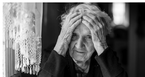
In foto: una signora anziana

Anziani La violenza contro l'anziano si presenta con una fenomenologia piuttosto complessa, di difficile e incerta classificazione, che sfugge pertanto sia alle categorie e agli strumenti di ricerca, sia alle statistiche giudiziarie. Più che di reati sarebbe, in questi casi, corretto parlare di «danno», di «abuso», di «maltrattamento»; concetti che non sono agevolmente rilevabili e pertanto non vengono riportati nelle statistiche. Per questo motivo risulta ancora più necessario riflettere su questo tipo di «abuso» che a volte viene inflitto senza averne piena consapevolezza.