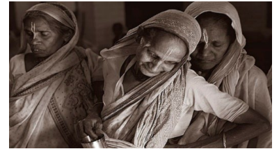
In foto vedove indiane

Mentre le vedove attraversano le proprie esperienze di dolore, perdita o trauma dopo la morte del coniuge, molte possono anche affrontare insicurezza economica, discriminazione, stigmatizzazione e pratiche tradizionali dannose sulla base del loro stato civile. In molte culture la vedovanza è stigmatizzata e vista come fonte di vergogna. In altre, si crede che le vedove siano maledette e associate anche con la stregoneria.