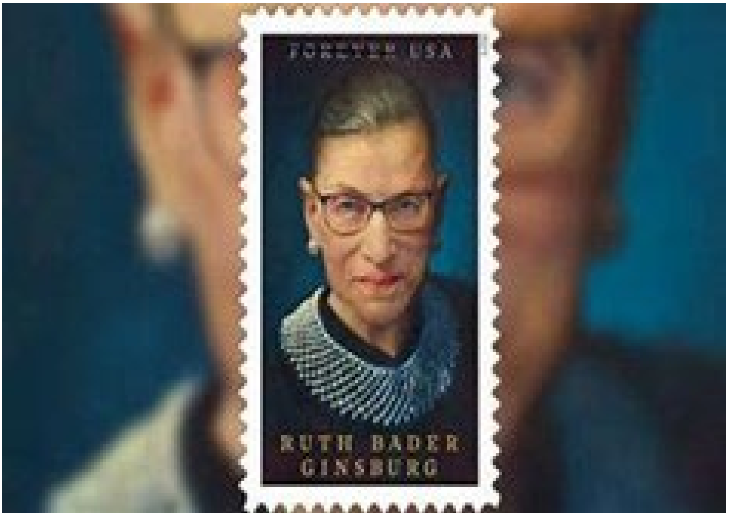
Nel 2023 francobollo in onore di Ruth Bader Ginsburg

Una sfida giuridica che forse non cesserà mai di essere combattuta ma che dovrà esserlo sempre, con lo strumento del diritto; anche, quando occorra, con il diritto dissenziente e non conforme, quello che RBG amava evocare con la sua espressione più nota e iconica: «I dissent».